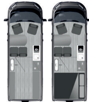
FURGOK® XPACE 600