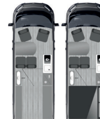
FURGOK® XPACE 600+