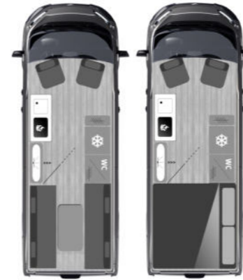
NEU FURGOK® X- LOUNGE Duo 600+