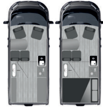
FURGOK® XPACE 540