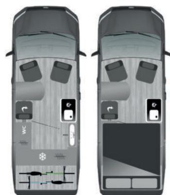
FURGOK® XPANSION 600 NEU