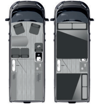
FURGOK® FAMILY 600+