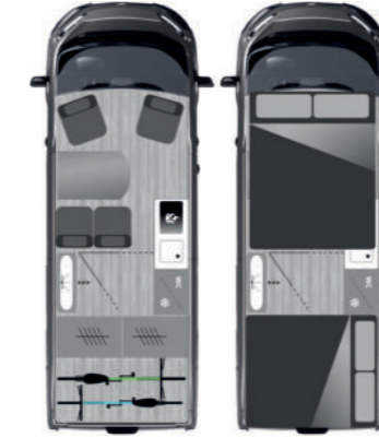
FURGOK® X-SPORT 600+