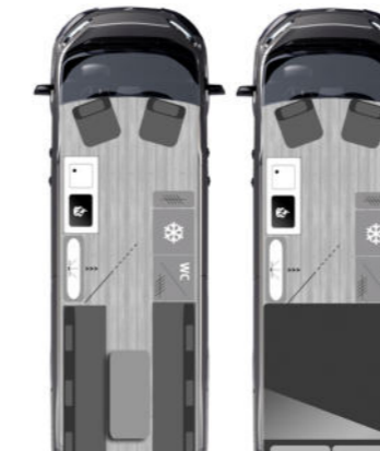
NEU L4H3 | Länge 640 cm | Höhe 290 cm FURGOK® X-LOUNGE 640+ Duo