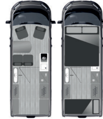
FURGOK® XPACE2 600+