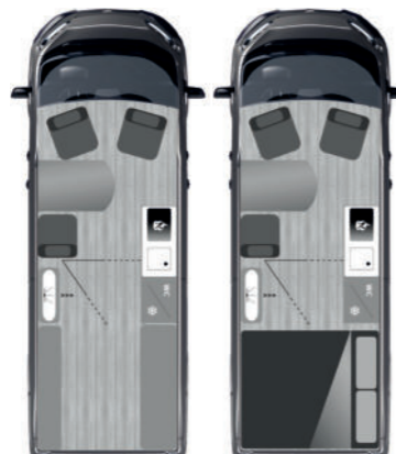
L3H3 | Länge 600 cm | Höhe 290 cm FURGOK® XPACE 600+ Trio